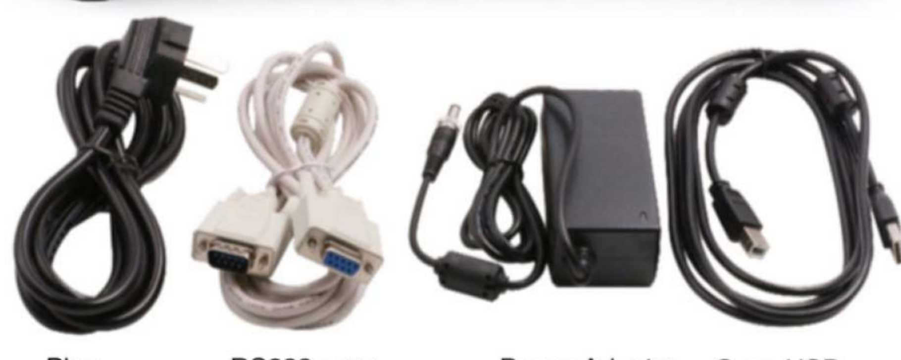
Plug RS232 cavo Power Adapter Cavo USB